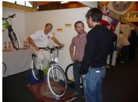
Andere Aussteller der Messe wurden erkundet...